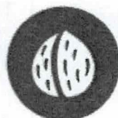
FRUTOS DE CASCA RIJA